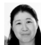
▶ Akiko Takahashi Clinic of Gastroenterology Saku Central Hospital Nagano / Japan