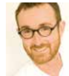
▶ Martin Mangold Zentrum für Innere Medizin Klinikum Garmisch-Partenkirchen GmbH Garmisch-Partenkirchen